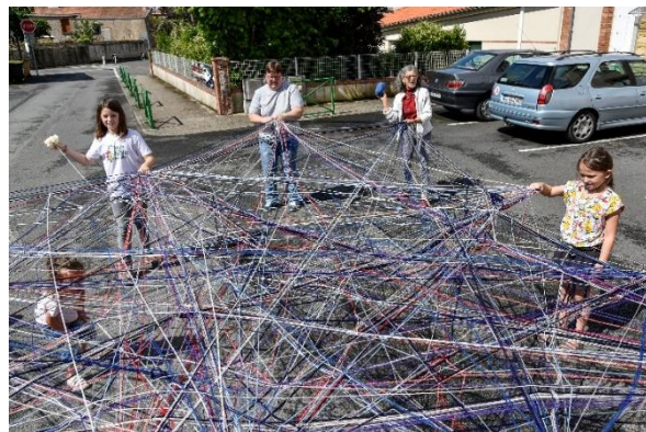
Tissage d'une toile d'araignée géante (Trampoline) avec le reste de laine lors du dernier temps fort de l'animation « De fil en aiguille » le dimanche 10 juin 2018.