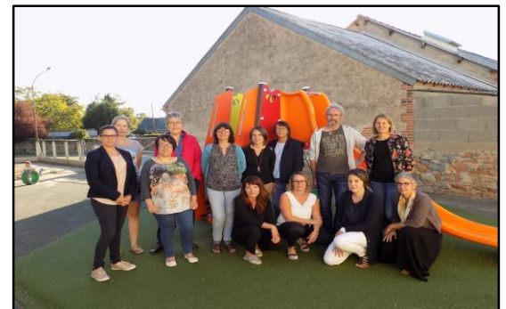
Equipe enseignante, responsables commissions A.P.E.L et membres O.G.E.C

La soirée s'achèvera sur un repas convivial.