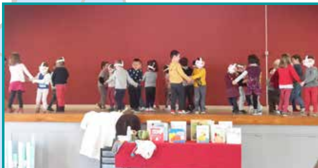
Mise en scène du livre « André au long nez » par les élèves de l'école publique de l'Èvre

Nous sommes attentifs à faire de la bibliothèque un lieu d'échange, de convivialité, ouvert à tous, adhérents ou non.