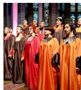
Chants de Coton