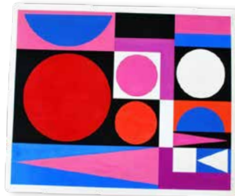
Auguste Herbin Accent n° 3, 1959 N° inv.: 988.109.1 Collection Musée d'Art et d'Histoire

À partir de cet alphabet, le Musée d'Art et d'Histoire propose aux enfants de participer à une œuvre collaborative. Inauguré lors des Journées Européennes du Patrimoine, ce projet invite les petits visiteurs à s'amuser et à s'appropriier l'article 31 de la CIDE en utilisant les formes colorées mises à leur disposition. La participation à ce projet est possible jusqu'au mercredi 20 novembre.