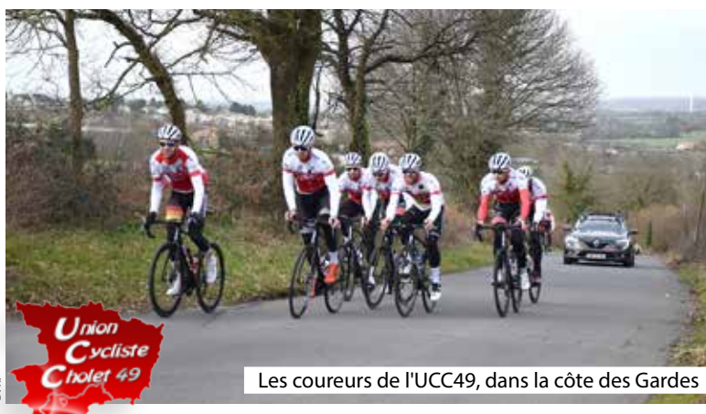
Les coureurs de l'UCC49, dans la côte des Gardes

Les entraînements se poursuivent à l'UCC49, y compris pour les jeunes pratiquant un sport extérieur. Les effectifs n'ont d'ailleurs que peu pâti de la crise. Néanmoins, le club a dû annuler le Grand prix des jeunes, prévu fin février, pour éviter l'afflux du public, composé de parents essentiellement lors de ces épreuves de jeunes coureurs. Il espère pouvoir organiser de nouvelles manifestations prochainement, comme il sait si bien le faire.