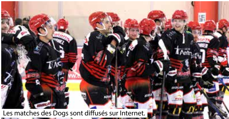
Les matches des Dogs sont diffusés sur Internet.

L'équipe choletaise de hockey sur glace a repris le championnat de Division 1 fin janvier, sous une nouvelle formule. Ses matches sont diffusés gratuitement sur Internet.