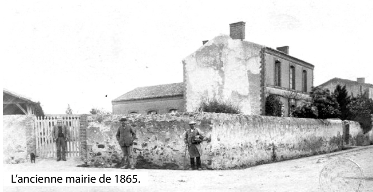
L'ancienne mairie de 1865.