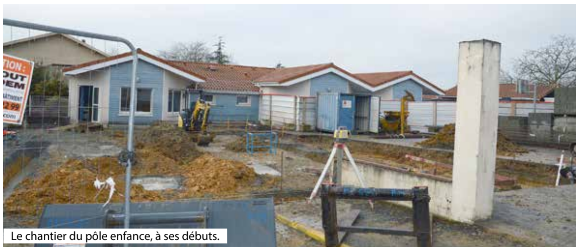
Le chantier du pôle enfance, à ses débuts.

« Cet équipement, adapté aux besoins actuels et futurs, pourra également être mis à disposition au bénéfice d'autres activités liées à l'enfance et la jeunesse, en fonction des nécessités à venir. Les salles pourront d'ailleurs être utilisées indépendamment les unes des autres »