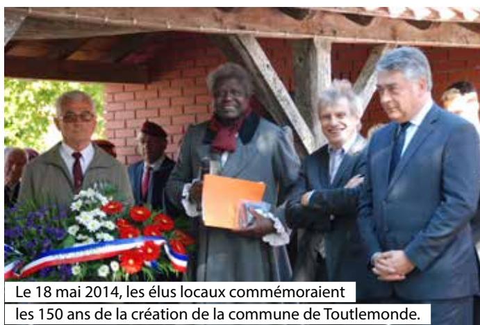
Le 18 mai 2014, les élus locaux commémoraient les 150 ans de la création de la commune de Toutlemonde.