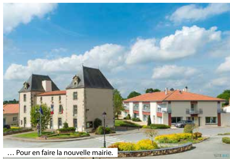
... Pour en faire la nouvelle mairie.

À travers cette rubrique, nous retraçons l'histoire de chaque mairie de l'Agglomération du Choletais. Épisode 9/36.