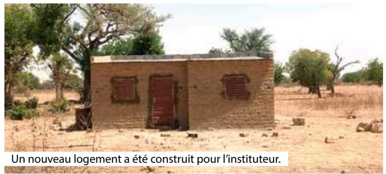
Un nouveau logement a été construit pour l'instituteur.

Depuis 2004, l'association Zoodo Toutlemonde Yargo œuvre pour offrir de meilleures conditions de vie aux habitants d'un village burkinabé. Le financement de projets autour de l'école en est la récente illustration.