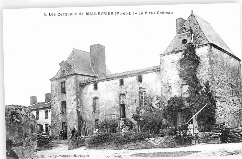
Le vieux logis tel que la Commune l'a acquis...