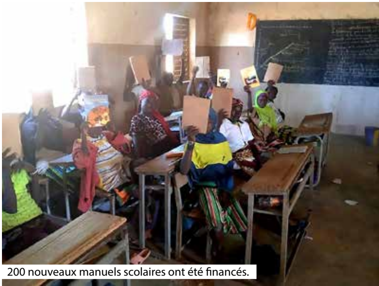
200 nouveaux manuels scolaires ont été financés.