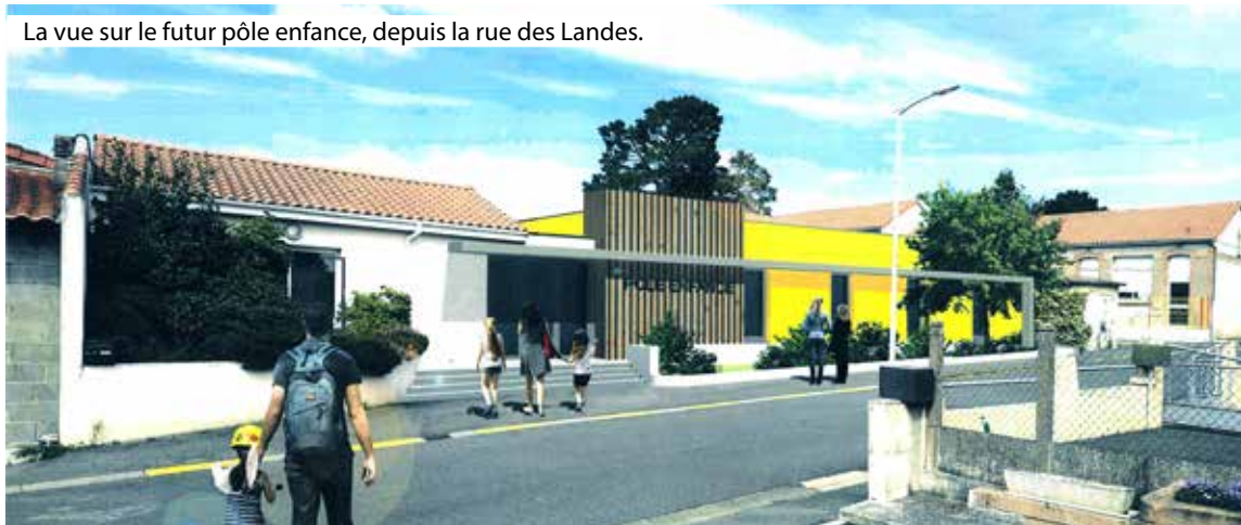
La vue sur le futur pôle enfance, depuis la rue des Landes.

Pour diffuser vos annonces dans Synergences hebdo, pensez à contacter la Rédaction trois semaines (minimum) avant la date de l'événement.