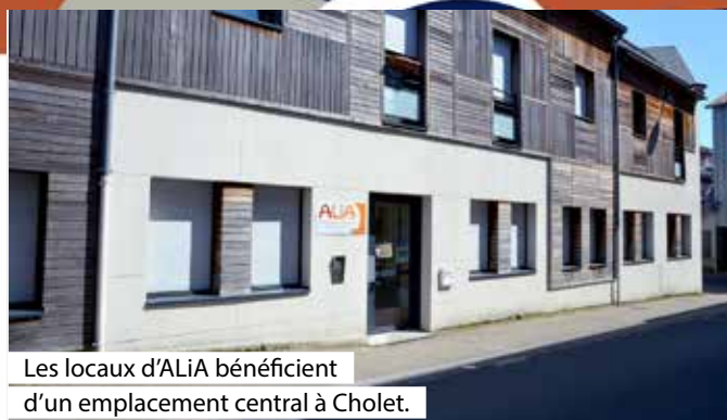
Les locaux d'ALiA bénéficient d'un emplacement central à Cholet.

Mickaël Doisneau, responsable de l'antenne choletaise d'ALiA