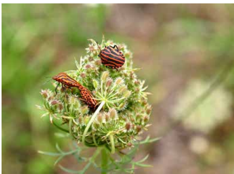
« À rayures et à pois ! » de Jean Dumont