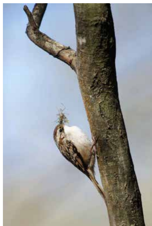
« Un grimpeur des jardins préparant son nid » de Luc Challet