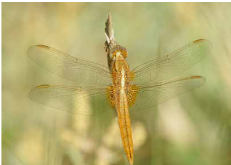
« Tout en transparence ! » de Xavier Lefort