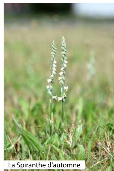
La Spiranthe d'automne

La Spiranthe d'automne ou Spiranthes spiralis, est la plus petite orchidée des Mauges, avec des pieds avoisinant les 20-30 cm. Elle est la dernière des orchidées à fleurir, à la fin de l'été. C'est une