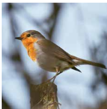
« Erithacus rubecula ou rougegorge » d'Alexandra Croispine