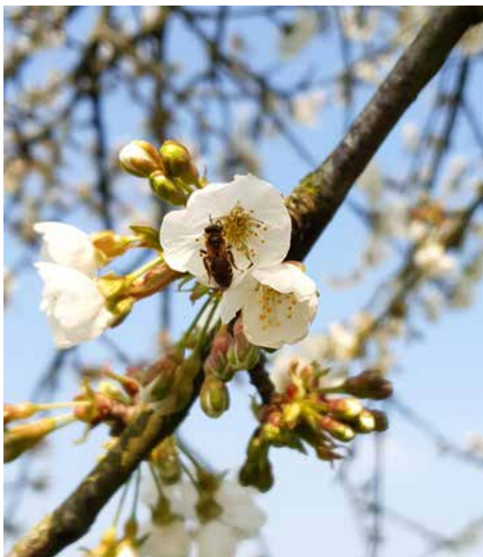
« Avant que le fruit naisse » d'Adèle Bodet