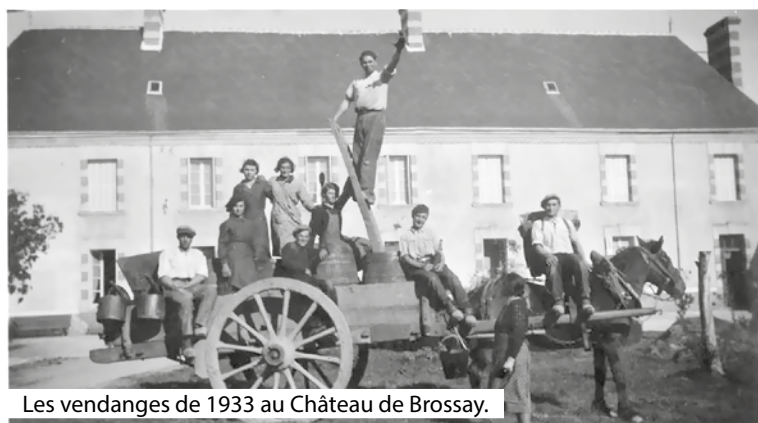
Les vendanges de 1933 au Château de Brossay.