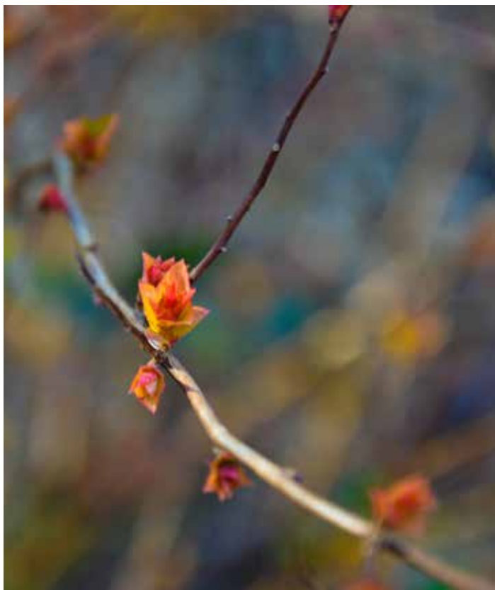
« L'orangé... au parc de Moine » de Christine Gelineau

À travers ces photos prises par des lecteurs de Synergences hebdo , profitez d'instantanés printaniers. Offrant ses plus belles couleurs, cette saison est celle où insectes et animaux se placent au centre du spectacle fleuri.