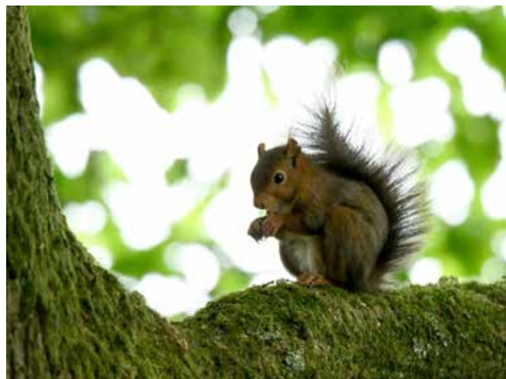
« Un écureuil qui a du panache ! au parc du golf » de Bruno Diguët