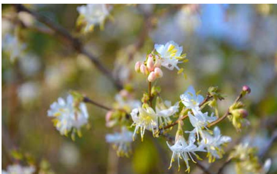
« Délicate blancheur... au parc de Moine » de Christine Gelineau