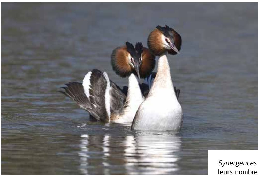
« Deux grèbes huppées navigant » de Didier Ferrand