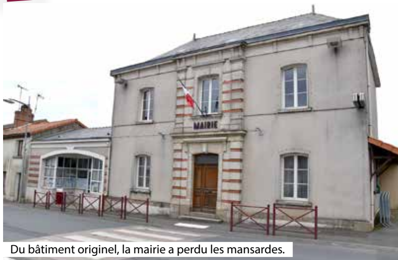
Du bâtiment originel, la mairie a perdu les mansardes.

À travers cette rubrique, nous retraçons l'histoire de chaque mairie de l'Agglomération du Choletais. Épisode 13/36.