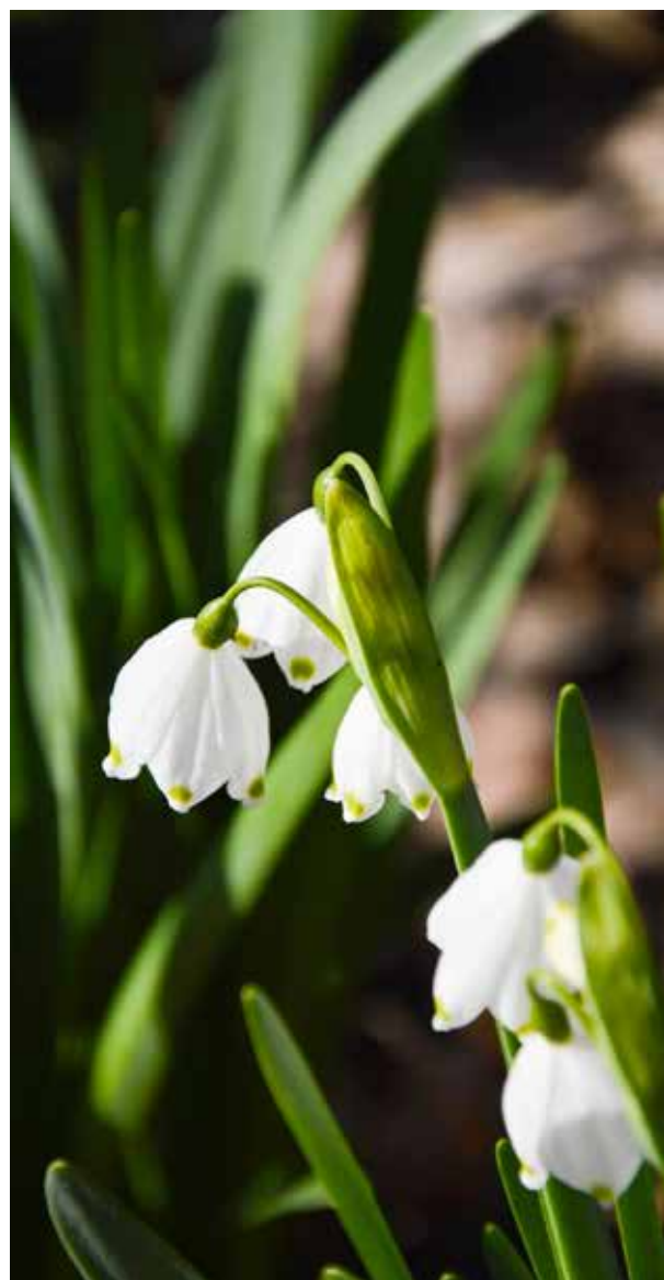
« Le muguet... au parc de Moine » de Christine Gelineau