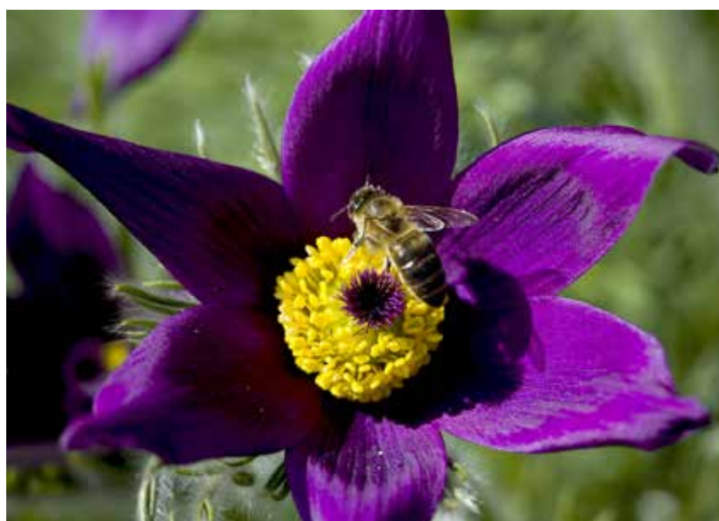
« Une butineuse sur une anémone pulsatile » de Gweltaz Burlot