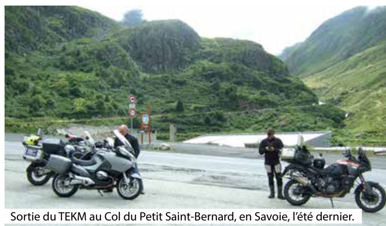
Sortie du TEKМ au Col du Petit Saint-Bernard, en Savoie, l'été dernier.

Quand les restrictions seront levées et les déplacements plus libres, le groupe s' imagine bien réitérer ses longues