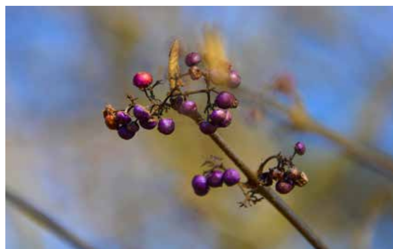
« Mauve... au parc de Moine » de Christine Gelineau