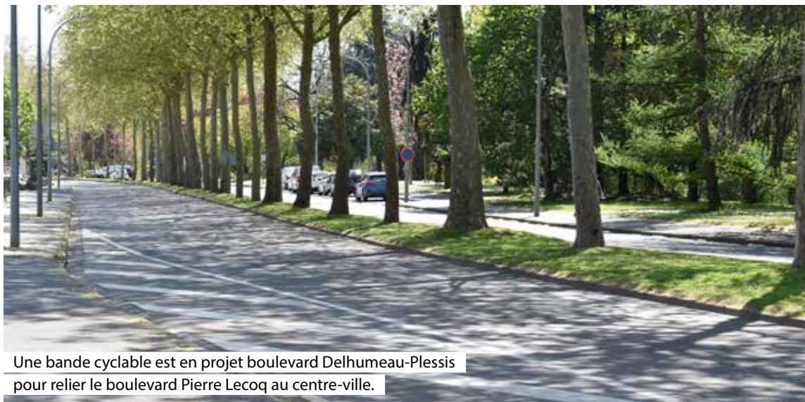
Une bande cyclable est en projet boulevard Delhumeau-Plessis pour relier le boulevard Pierre Lecoq au centre-ville.

Votée en mars dernier par les élus de l'Agglomération du Choletais (AdC), l'aide à l'achat d'un vélo à assistance électrique est effective depuis le mardi 20 avril dernier. Elle permet à tous les habitants du territoire intercommunal, âgés de 18 ans et plus, de bénéficier, sans condition de ressources, d'une subvention à hauteur de 25 % du coût du vélo, acheté chez l'un des vélocistes partenaires (lire ci-contre), dans la limite de 250 €. « Cette action s'inscrit pleinement dans le cadre du Plan Climat Air Énergie Territorial, commencé au second semestre 2020, rappelle Jean-Paul Brégeon, vice-président