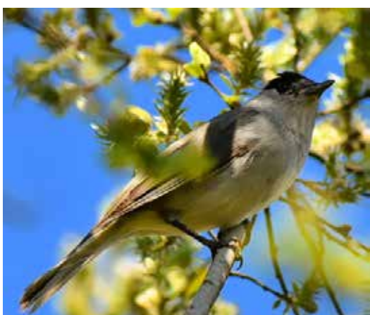
« Rester pour observer... ou s'envoler ? » d'Alexandra Croispine