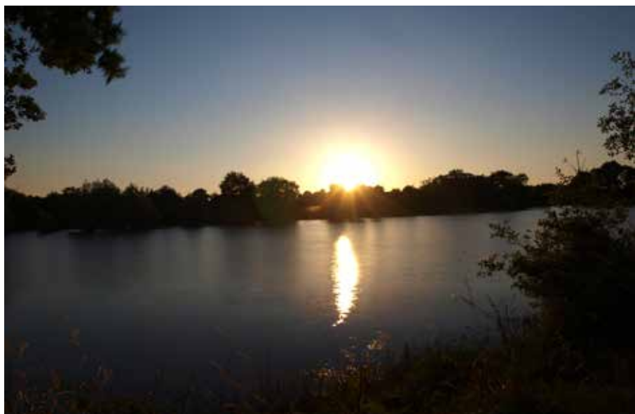
« Coucher de soleil sur le lac du Verdon » de Bruno Diguët