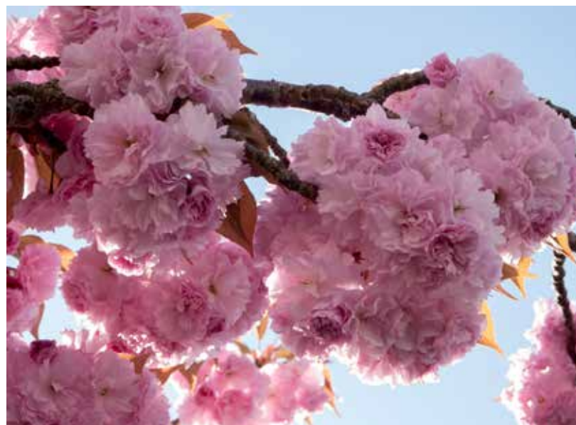
« Pompon fleuri » de Daniel Esnard