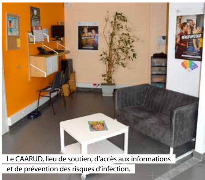
Le CAARUD, lieu de soutien, d'accès aux informations et de prévention des risques d'infection.

S-h : Quel accueil proposez-vous au CAARUD ?