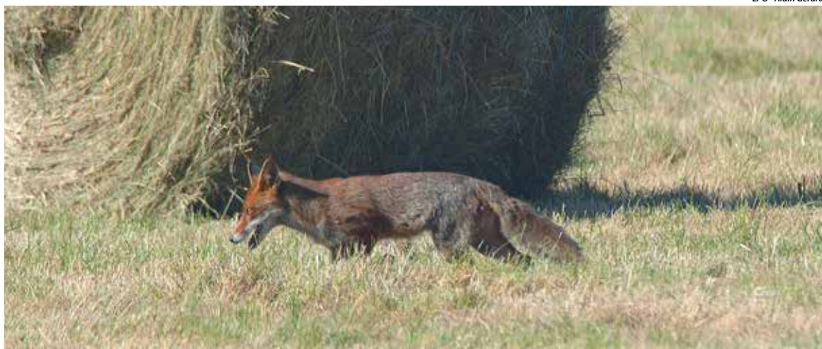
LPO - Alain Gérard

Ce spectacle, tout le monde peut l'observer avec un peu de chance lors d'une randonnée, matinale ou vespérale. De mars à juin, époque de l'élevage des jeunes, il n'est pas rare de rencontrer l'animal en train de « muloter », parfois même en plein midi, quand l'urgence d'une nombreuse nichée le commande. Le renard roux ( Vulpes vulpes ) appartient à la grande famille des canidés, au même titre que le chien ou le loup. Il ressemble d'ailleurs à un petit chien qui aurait le museau effilé et un pelage