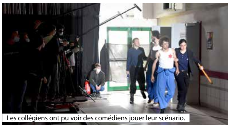
Les collégiens ont pu voir des comédiens jouer leur scénario.

Cette Journée particulière a pour objectif premier de favoriser une pratique cinématographique des collégiens et de leurs enseignants, en proposant une approche du cinéma adaptée aux élèves. Cela permet également de les confronter à des œuvres sur grand écran et en salle de cinéma, en favorisant la rencontre et l'échange avec des professionnels, de rendre compréhensibles les enjeux esthétiques et le langage cinématographique de façon concrète en favorisant l'expérimentation et la pratique, de renforcer le partenariat de Premiers Plans avec les collèges du département et d'encourager les enseignants à inscrire le cinéma dans leurs projets pédagogiques. Mardi 18 mai dernier, ambiance tournage, donc, dans la salle Leclerc mise à disposition par la Commune, pour les 28