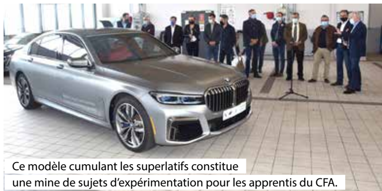
Ce modèle cumulant les superlatifs constitue une mine de sujets d'expérimentation pour les apprentis du CFA.

Jeudi 20 mai, une sacrée surprise attendait les apprentis mécaniciens, dissimu-