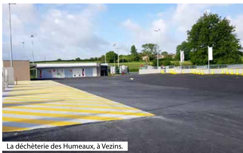
La déchèterie des Humeaux, à Veziens.