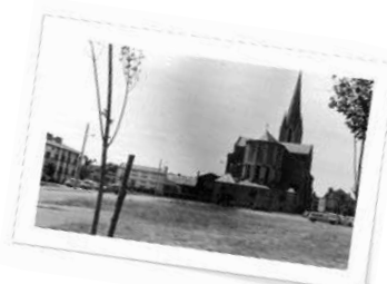
La place Hubert Cassin en 1972

Jean-Louis Chapron Le Vieux Pont à Trémentines Tél. : 02 41 62 76 63 André Boutin 33 rue du Prieuré à Trémentines Tél. : 02 41 62 71 82