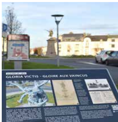
Ci-dessus (à g.), la statue à la gloire des vaincus français, Gloria Victis, située place de la République et (à d.), le monument à la mémoire des mobilisés de la 2 e légion du Maine-et-Loire lors de la guerre de 1870, situé boulevard du général Faidherbe. Des pupitres en donnent des précisions historiques.