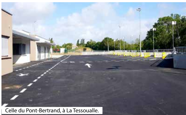
Celle du Pont-Bertrand, à La Tessoualle.

Service Gestion des déchets Tél.: 0800 97 49 49 (n° vert gratuit depuis un fixe) contactdechets@choletagglomeration.fr