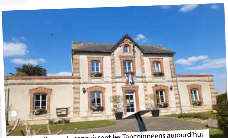
La mairie telle que la connaissent les Tancoignéens aujourd'hui.