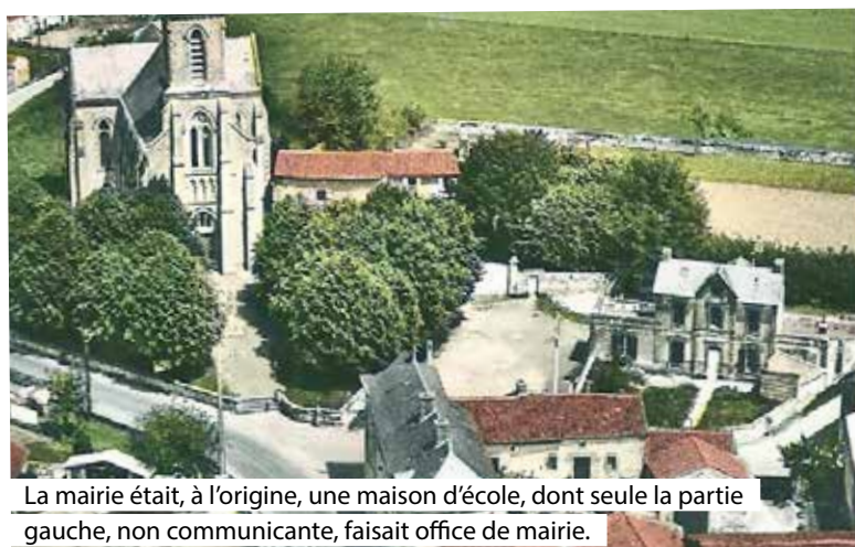
La mairie était, à l'origine, une maison d'école, dont seule la partie gauche, non communicante, faisait office de mairie.

À travers cette rubrique, nous retraçons l'histoire de chaque mairie de l'Agglomération du Choletais. Episode 16/36.