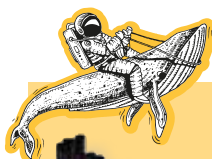
Une création d'Éva Premillieu