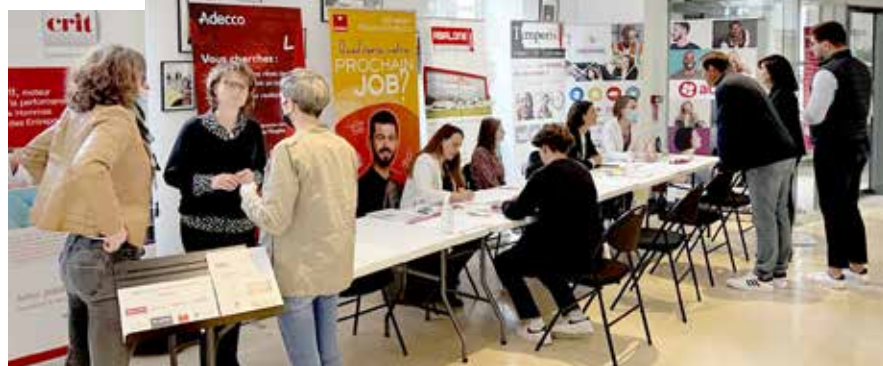
Medef du Pays choletais

Plus de 30 entreprises du Choletais étaient présentes au Forum jobs d'été & jobs étudiants organisé par la Ville de Cholet, en partenariat avec le Medef du Pays choletais. Avec plus de 800 postes à pourvoir, les jeunes du territoire, âgés de 18 à 25 ans, ont pu trouver un emploi saisonnier pour les vacances ou un petit boulot durant l'année dans de nombreux secteurs : restauration, hôtellerie, agroalimentaire, industrie, transport, agriculture, sport, commerce, services, etc. À noter qu'un forum consacré à l'emploi des plus de 50 ans sera organisé le jeudi 2 juin prochain, à la salle des Fêtes.