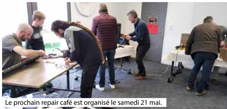
Le prochain repair café est organisé le samedi 21 mai.

Une douzaine de bénévoles s'étaient mobilisés lors de cette matinée qui a été très appréciée par les utilisateurs venus avec du matériel défectueux : télévision, aspirateur, chauffage d'appoint, piano, etc., en vue de leur don-