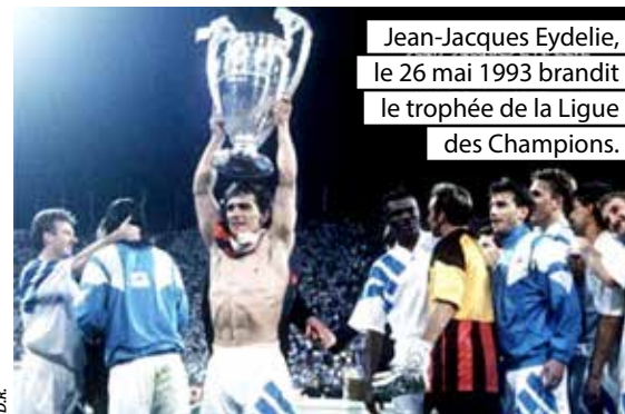
Jean-Jacques Eydelie, le 26 mai 1993 brandit le trophée de la Ligue des Champions.

mouvement, le « jeu à la nantaise » et un souvenir ému de ces années d'apprentissage aux côtés de tacticiens hors pair, qui ont marqué toute une génération (Jean Vincent, « Coco » Suaudeau, etc.). Il a débuté dans le milieu professionnel sous les couleurs jaunes et vertes du club de Loire-Atlantique en 1984, à l'âge de 18 ans, en remplaçant José Touré, en cours de match.