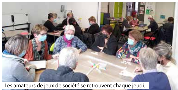
Les amateurs de jeux de société se retrouvent chaque jeudi.

social. Le prochain repair café a lieu le samedi 21 mai, de 9 h à 12 h. Toujours à l'Exeko, un groupe « jeux », comptant pour l'heure une dizaine de personnes, se réunit désormais tous les jeudis, de 14 h à 17 h 30, pour le plaisir de jouer aux jeux de société. Au programme : des parties de Tac-tik , de Uno , de 6 qui prend , de Aventuriers du Rail , de Mexican Train , etc. D'autres temps forts, ouverts à tous, seront organisés dans l'année.