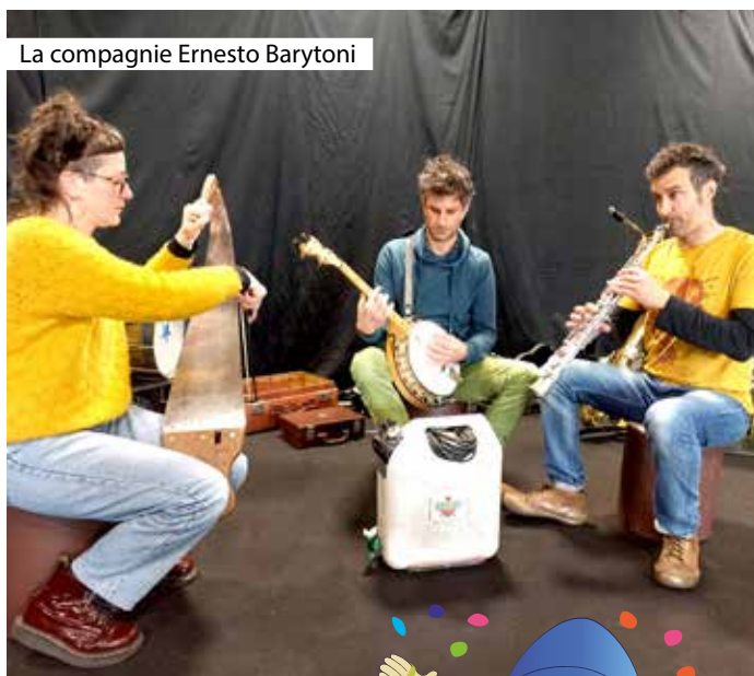
La compagnie Ernesto Barytoni