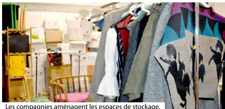
Les compagnies aménagent les espaces de stockage, restés brut, à leur guise.