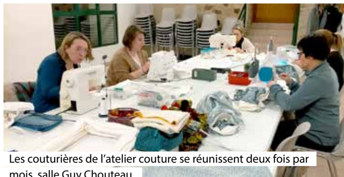
Les couturières de l'atelier couture se réunissent deux fois par mois, salle Guy Chouteau.

Au sein de l'atelier couture du Centre Socioculturel Intercommunal (CSI) Chloro'fil, une opération de solidarité est en cours, en faveur du service de néonatalogie du CHU d'Angers.