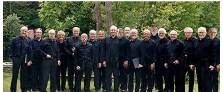
Le chœur choletais de voix d'hommes Expression compte une vingtaine de chanteurs, évoluant sur un répertoire de chants sacrés, traditionnels, régionaux, ainsi que quelques chants humoristiques.

Le chœur d'hommes Expression organise un concert, ce dimanche 8 mai, à l'église du Sacré-Cœur, à 15 h 30.