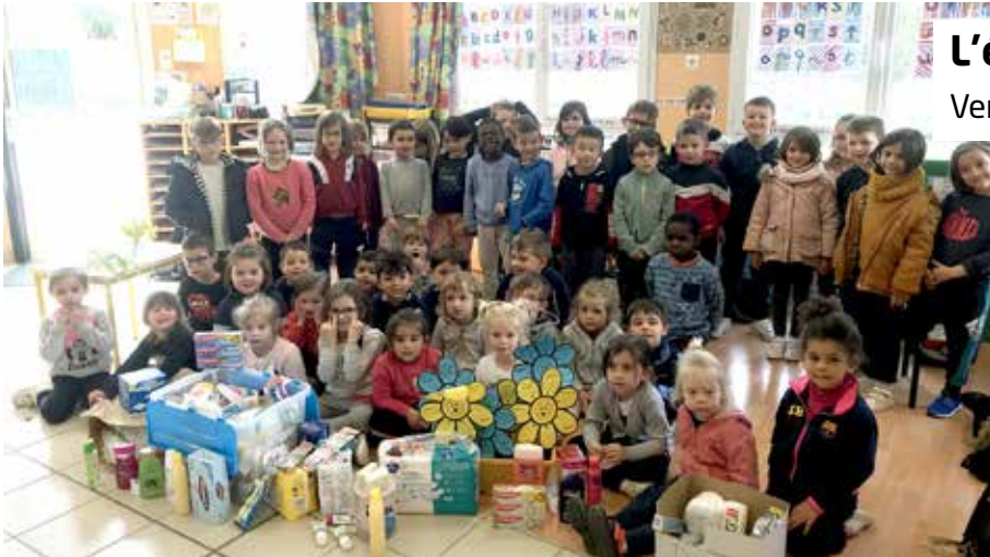
Mairie de Toutlemonde

La communauté éducative de l'école Abbé Louis Ferrand s'est associée à l'action en faveur de l'Ukraine proposée par la Municipalité. À ce titre, les 152 élèves ont partagé des temps forts autour de la solidarité. Toutes les classes ont pris part à des débats, des temps de jeux, des bricolages, de la lecture et des courses solidaires. Des dons de produits d'hygiène et d'argent, en faveur de l'Ukraine, ont été collectés.