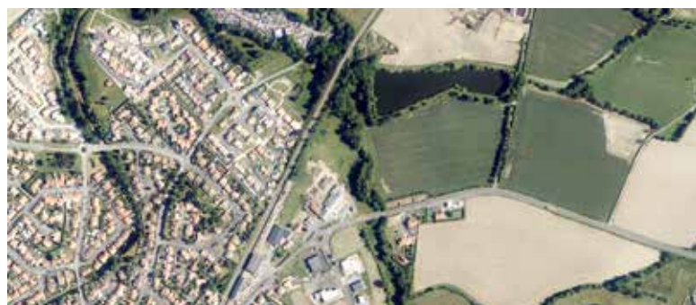
ville de Cholet