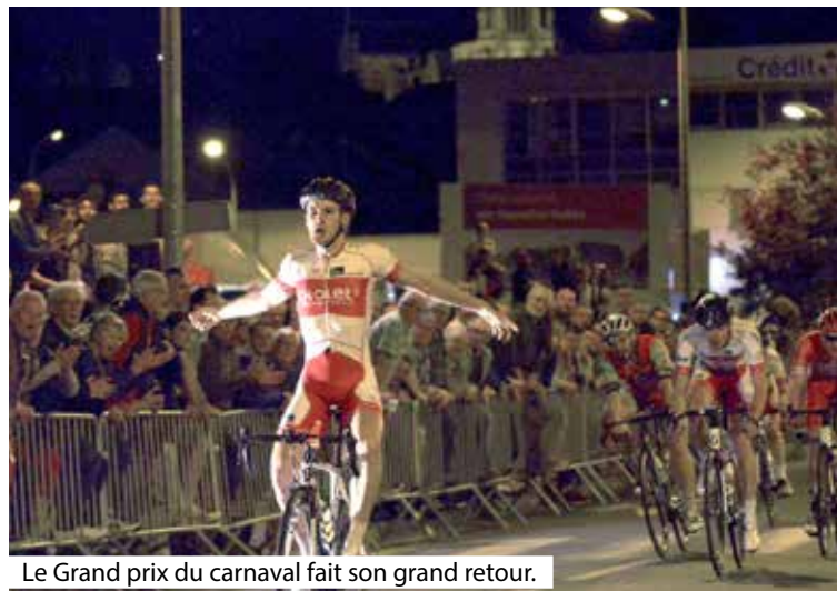
Le Grand prix du carnaval fait son grand retour.

Parmi les festivités proposées pendant toute la semaine entre les défilés de jour et de nuit du carnaval de Cholet, le Grand prix cycliste reste un incontournable que les amoureux de la Petite reine retrouveront également avec plaisir cette année, après deux éditions annulées.