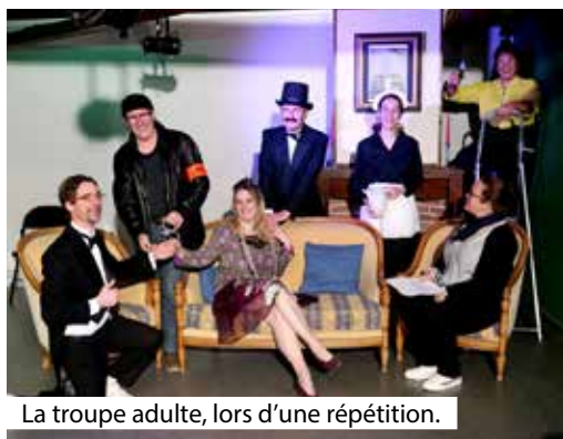
La troupe adulte, lors d'une répétition.

Cette première représentation est proposée le samedi 14 mai, à 20 h, avec la troupe Les Saltimbanques, composée de jeunes acteurs. Ils joueront Le train vers l'adolescence .