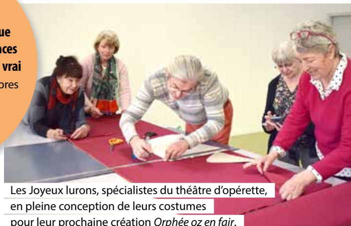
Les Joyeux lurons, spécialistes du théâtre d'opérette, en pleine conception de leurs costumes pour leur prochaine création Orphée oz en fair .