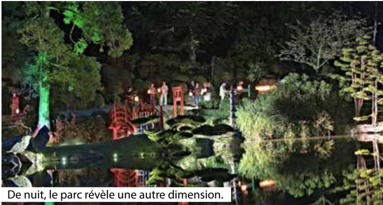
De nuit, le parc révèle une autre dimension.