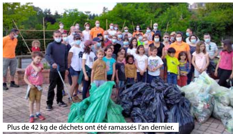
Plus de 42 kg de déchets ont été ramassés l'an dernier.