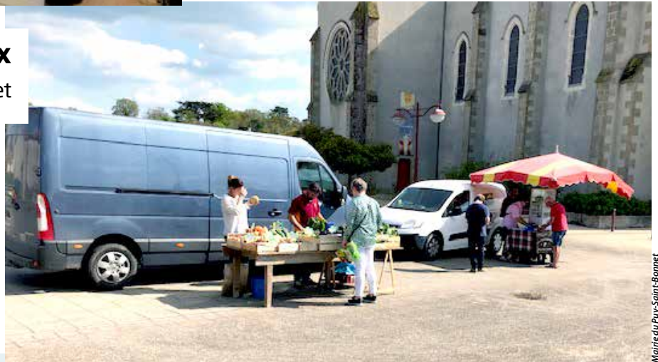
Mairie du Puy-Saint-Bonnet

Depuis mi-avril, la commune accueille un marché de producteurs locaux, tous les vendredis, à partir de 16 h 30, sur la place de l'église. En complément du marché traditionnel du mercredi matin, il réunit des commerçants de proximité et ne demande qu'à s'étoffer.