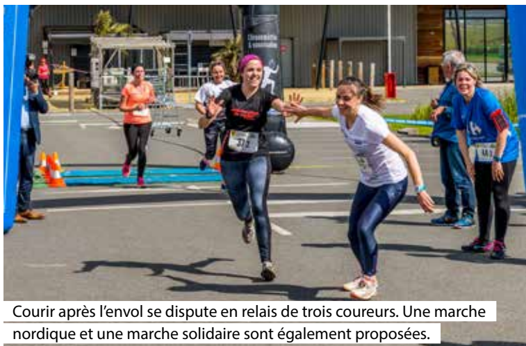
Courir après l'envol se dispute en relais de trois coureurs. Une marche nordique et une marche solidaire sont également proposées.

L'association Après l'envol organise la troisième édition de sa course solidaire en relais, le dimanche 22 mai prochain. Nouveauté cette année: une marche, accessible à tous.