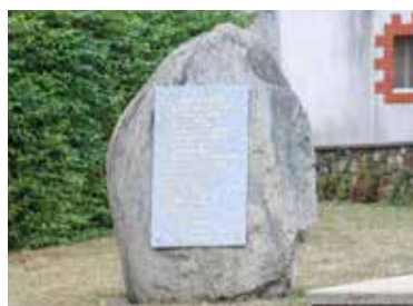
Beaucoup de monde est attendu au monument aux Morts, situé près de la mairie de Toutlemonde.

- à 12 h : nouveau défilé de l'église à la mairie, toujours avec les fanfares et les porte-drapeaux en direction du monument aux Morts près de la mairie, - à 12h15 : cérémonie du souvenir avec les hymnes devant le monument aux Morts.